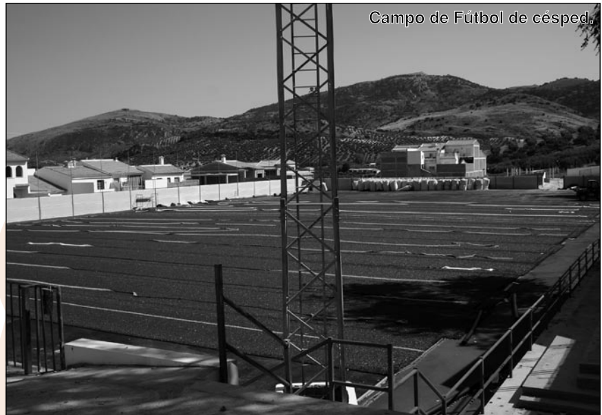
Campo de Fútbol de césped.

Museo del Aceite: Que no gusta que sea en la Estación, aunque sea un magnífico lugar, y pese a que el lugar donde se situará, quedase con