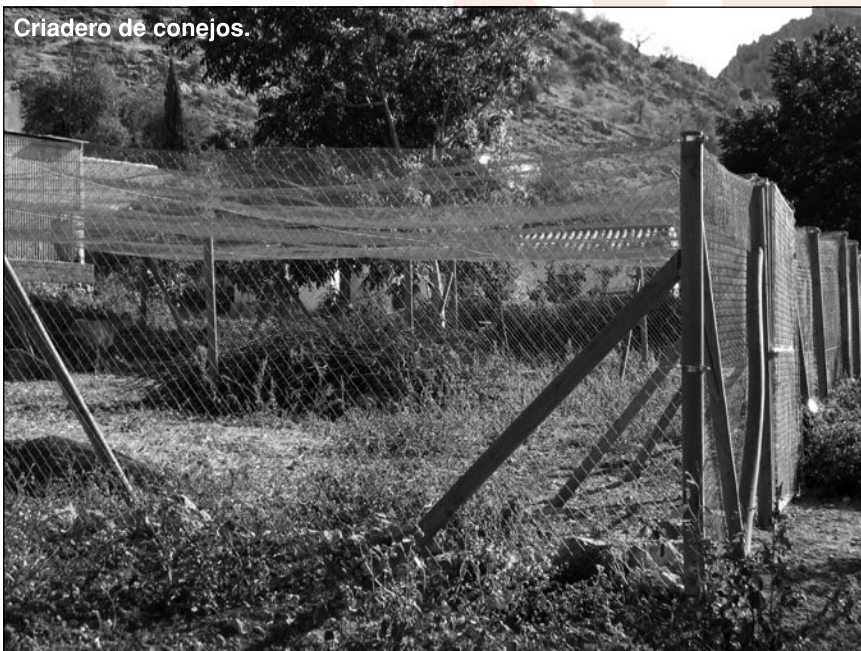
Criadero de conejos.

lo que deja de haber, pero en cualquier caso les informamos de que existe una Asistente Social y un Educador Social que tienen entre sus estudios, conocimientos, capacidades y atribuciones, las de atender los asuntos relacionados con la mujer, además de una técnico de la UDTLT.